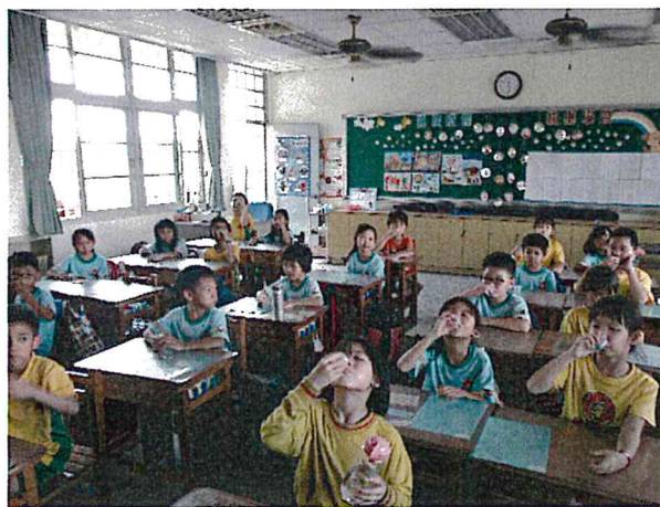
說明： 含氟漱口水活動