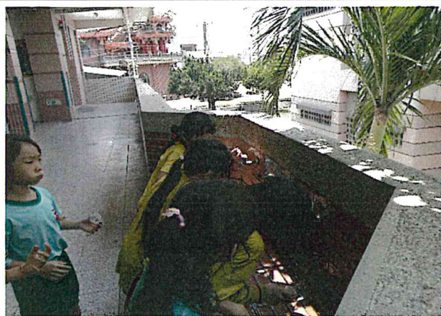
說明： 餐後潔牙活動