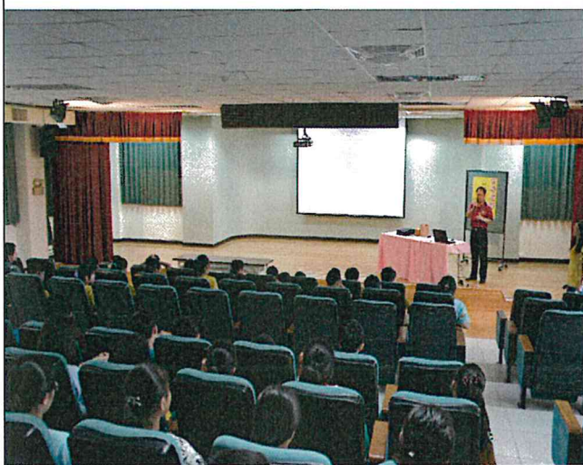
說明： 正確刷牙觀念(牙醫師)